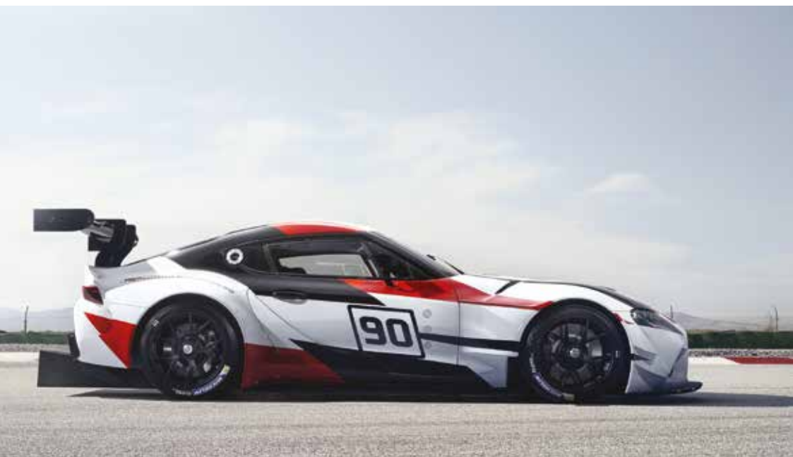
TOYOTA SUPRA A70 | 1986